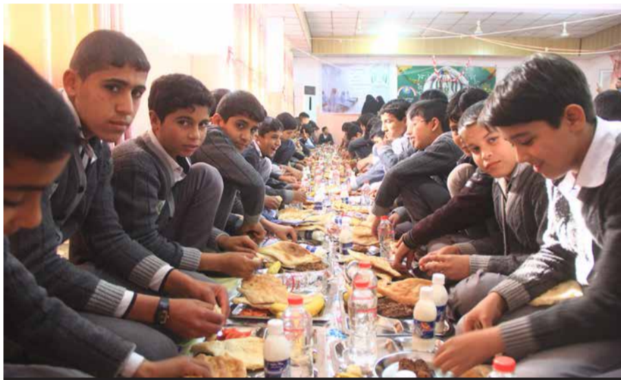
للتلاميذ مميزات راتب شهري ونقل وطعام ومستلزمات دراسية