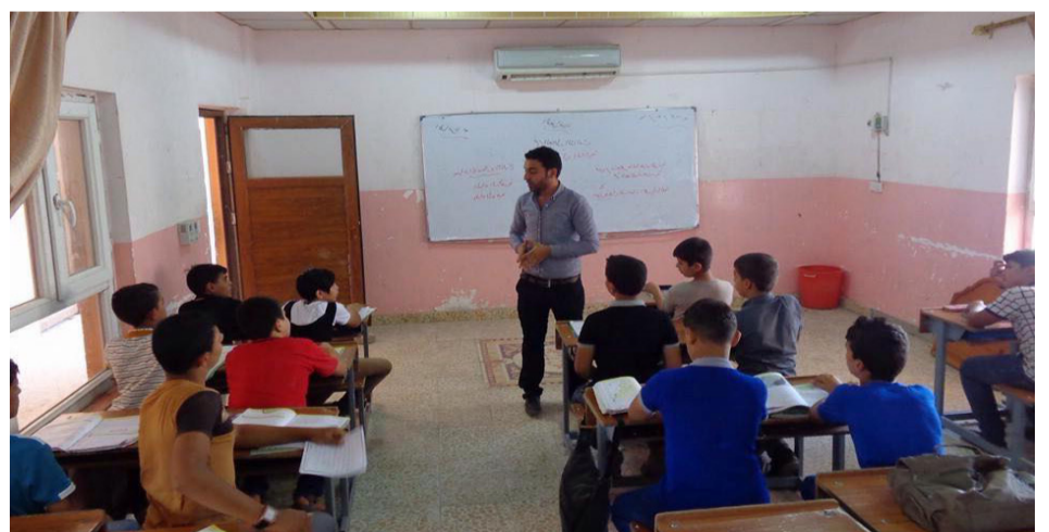
مدارسنا من القليلة في المحافظة درست مادة الحاسوب من الصف الأول الابتدائي