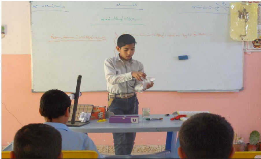
نحرص على تنمية مواهب التلاميذ ودمجهم في المجتمع