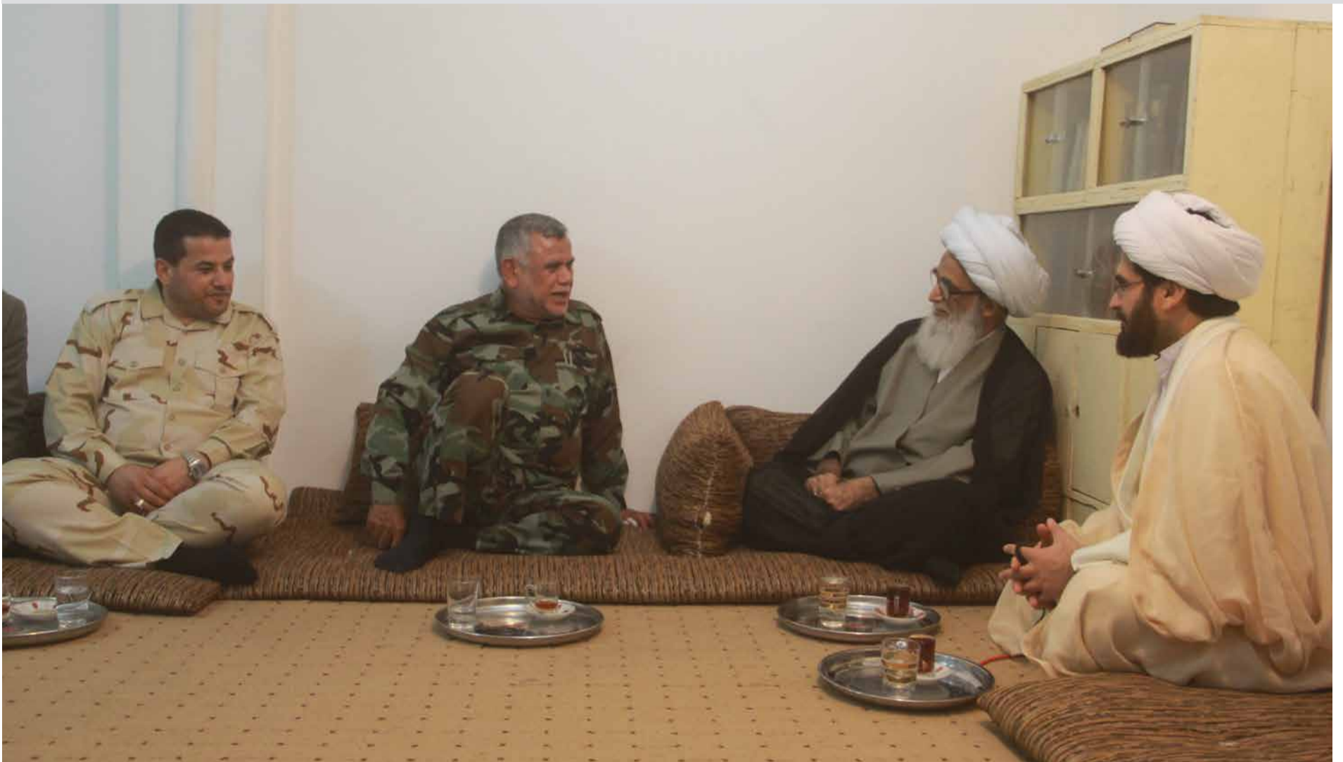
سماعة المرجع (دام ظلّه) لدى لقاءه بالعامري:

الحديث عن الحشد الشعبي والانتصارات المتتالية لمختلف الفصائل هي محور مهم من محاور توجيهات سماعة المرجع (دام ظلّه) فبين الاشتياق الى موعد الاعلان النهائي لتحرير العراق على يد ابناءه يؤكد سماحته على ضرورة توحيد الصف امام مخططات اعداء الاسلام والوقوف الى جانب عوائل الحشد الشعبي مغنويا وماديا