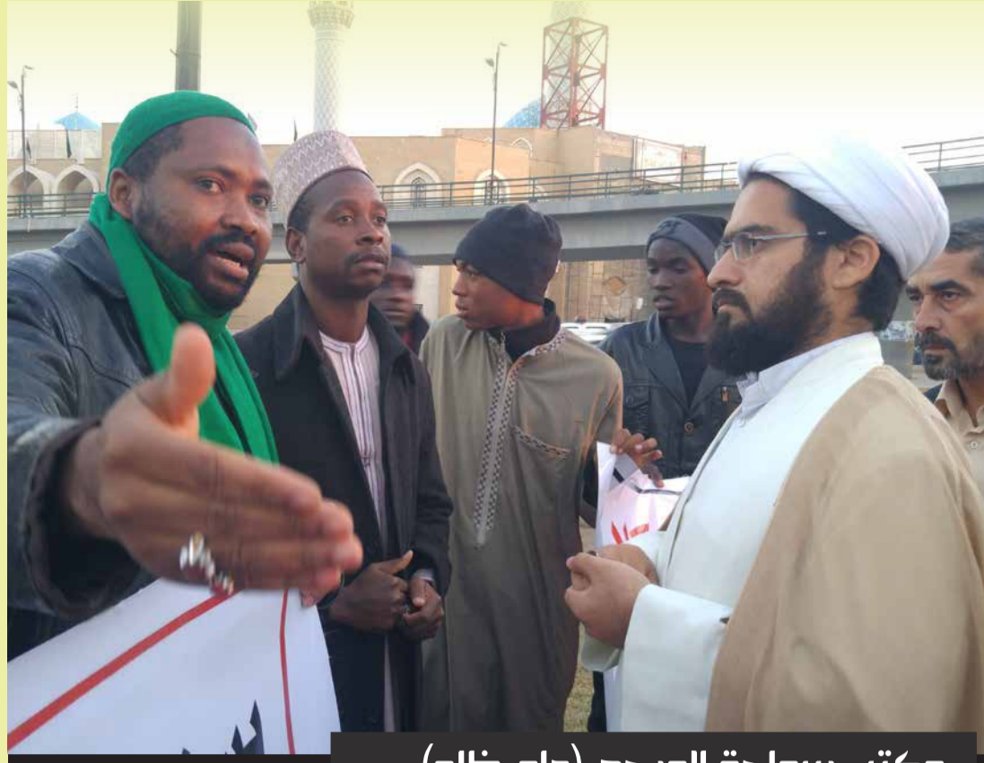
مكتب سماحة المرجع (دام ظله):