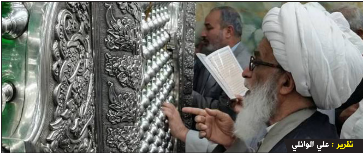
تقرير: علي الوائلي

مرّ سماحة المرجع (دام ظلّه) بوعكةٍ صحية، أعاقته عن إعطاء الدروس الحوزوية والبرنامج اليومي، ونقل على أثرها إلى مستشفى الكفيل لإجراء الفحوصات اللازمة للاطمئنان على صحته، وتم إجراء المطلوب من التحاليل والفحوصات، وهنا نظمت المؤمنين أن صحة سماحتها على مايرام بحمد الله، ويزاول عمله اليومي من الدروس واللقاءات وغيرها وفق المنهاج السابق. وعلى صعيد متصل تشرف سماحتها بزيارة ضريح سيد الشهداء الإمام الحسين (عليه السلام)، وضريح أبي الفضل العباس (عليه السلام)، وتوجّه بالدعاء إلى الله بتعجيل فرج مولانا صاحب الزمان (عجل الله تعالى فرجه) وبالنصر للعراق على أعدائه، والخاص من المفسدين والفاستين..