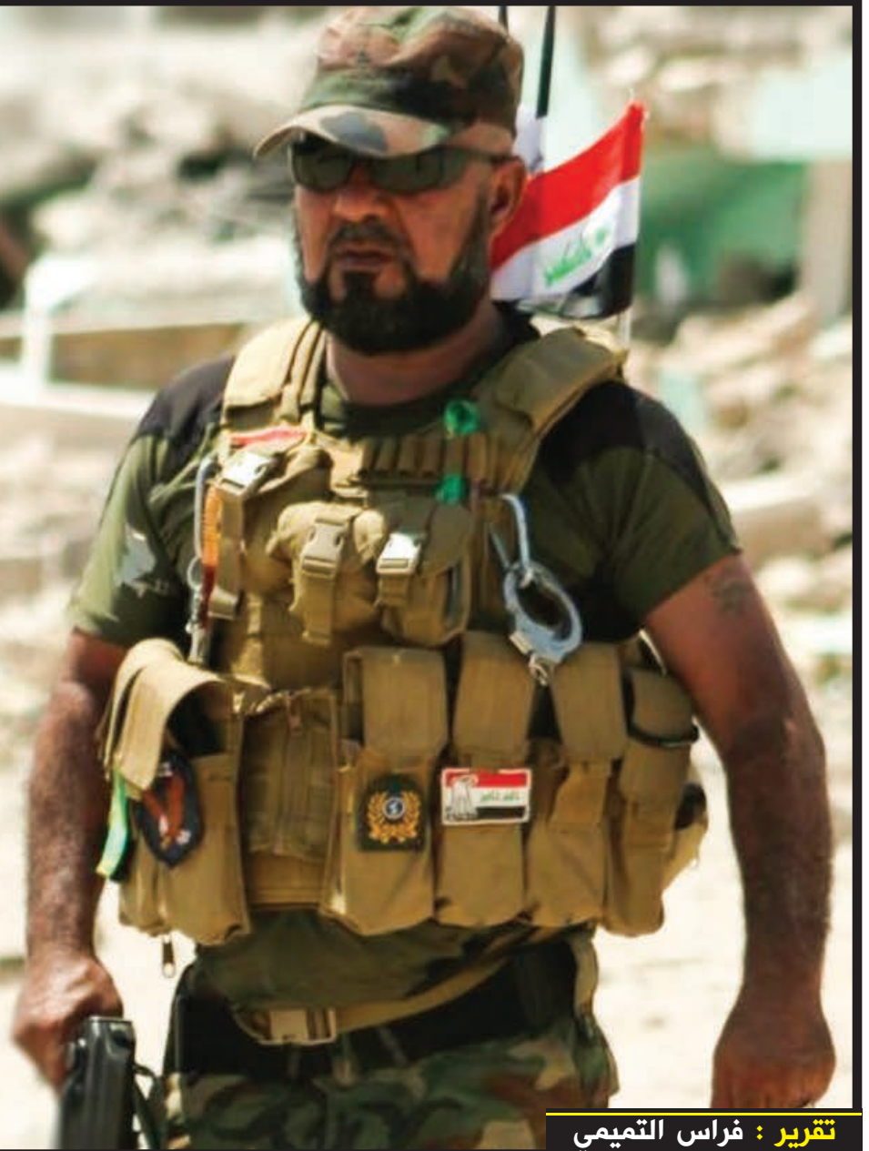
تقرير : فراس التميمي

والوطن، وتغدق عليهم بالغيرة العراقية الأصيلة.