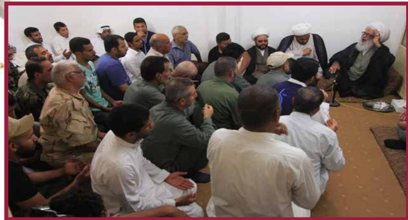
عيد الغدير من أشرف الأعياد؛ لأن به تمام دين الإسلام ومسيرة خير الخلق أجمعين النبي محمد (صلوات الله عليه واله) .