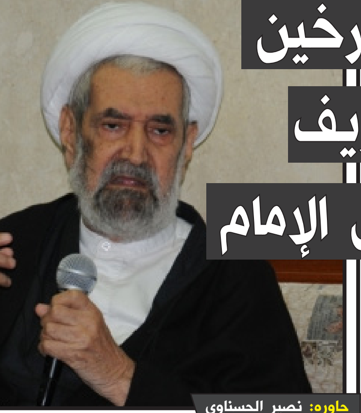
حاوره: نصير الحسناوي

للنيل منه، وكان معاوية بن أبي سفيان الذنب الجاهلي الذي لم يؤمن بالله لا هو ولا أبوه ولا أمه طرفة عين اتخذوا هذه الكنية سبباً إلى التشهير بعلي إذ أوعز إلى الخطباء الذين يعيشون على موائد السلطة أن يلغوا أبا تراب في أعياد الجمعة وسائر الأعياد الأخرى.