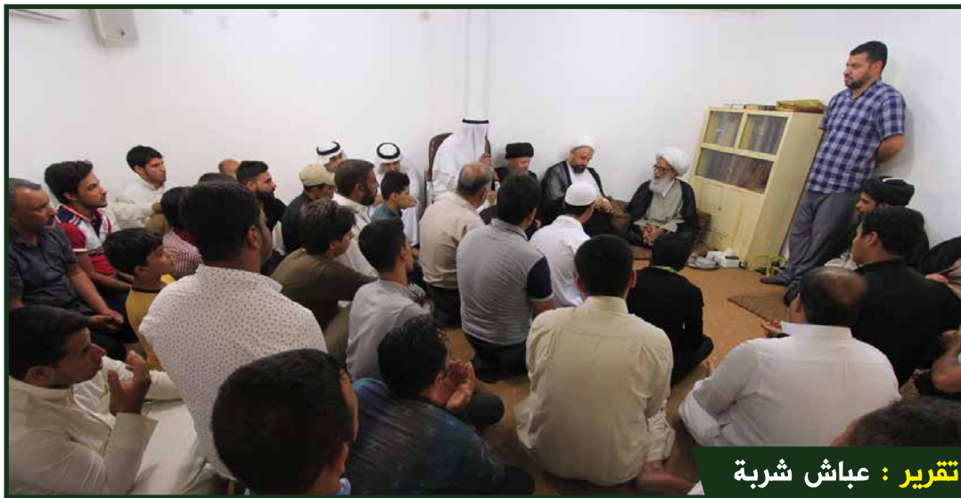
تقرير: عباس شربة

أوضح سماحة المرجع (دام ظله) في توجيهاته المباركة لعدد من أبناء دول الخليج، أن الانتهاج من سيرة النبي المصطفى وآله الأطهار ونقل المبادئ الصحيحة لمدرستهم الخالدة هو نقل للإسلام الأصيل الذي وصل عن طريقهم، مشيراً إلى ضرورة نشر تلك المبادئ للعالم؛ ليتعرفوا على السماحة والمحبة والاخاء والتعايش السلمي والدعوة لله العلي القدير، بعد أن حاول أعداء الإسلام تشويه صورته والصاق شتى التهم به، واختتم حديثه بالتضرع لله سبحانه بأن يمن على جميع أتباع أهل البيت (عليهم السلام) بالصحة والعافية وأن يجنبهم شر أعدائهم