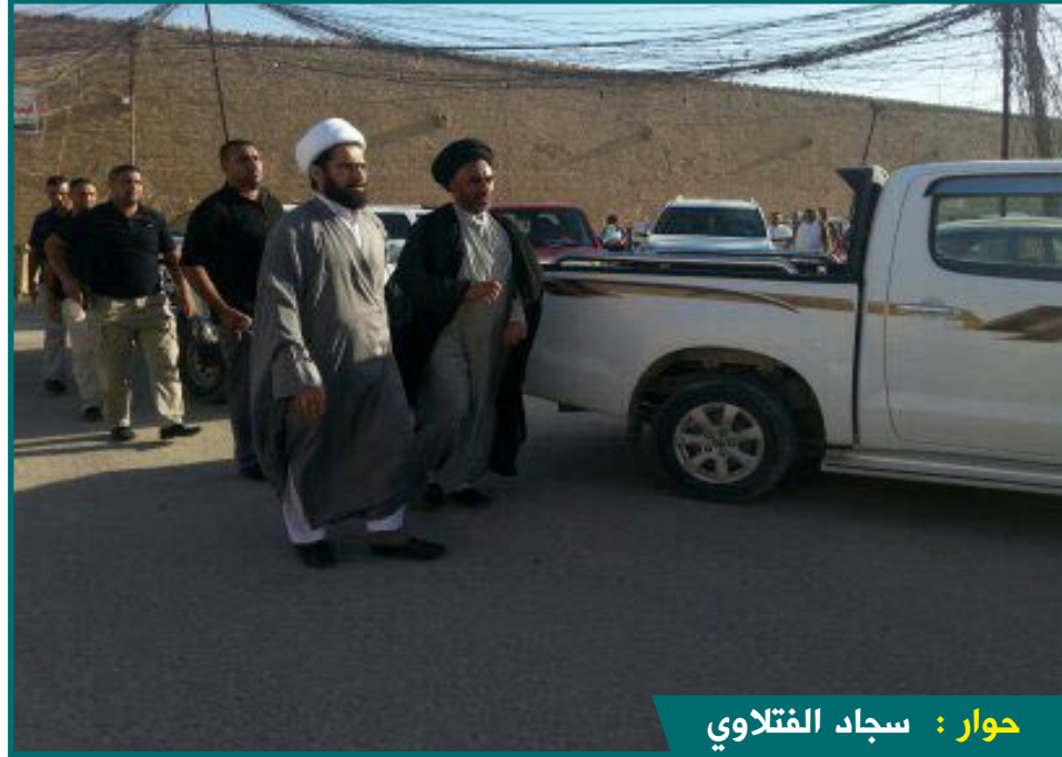
حوار : سجاد الفتلاوي