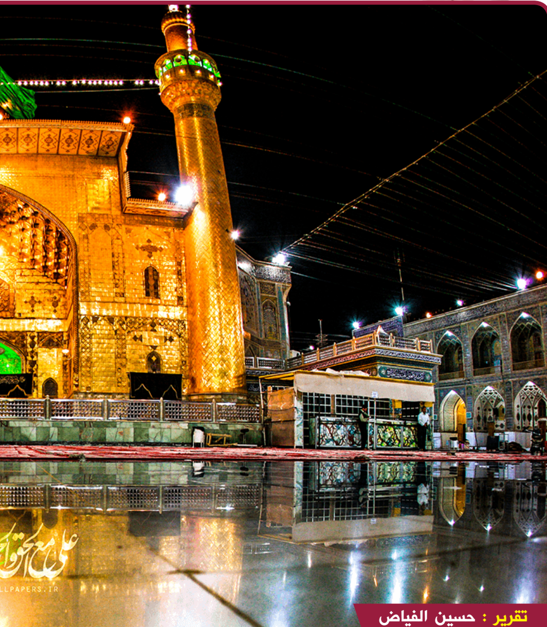
تقرير : حسين الفياض