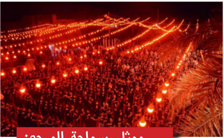
ممثل سماحة المرجع: