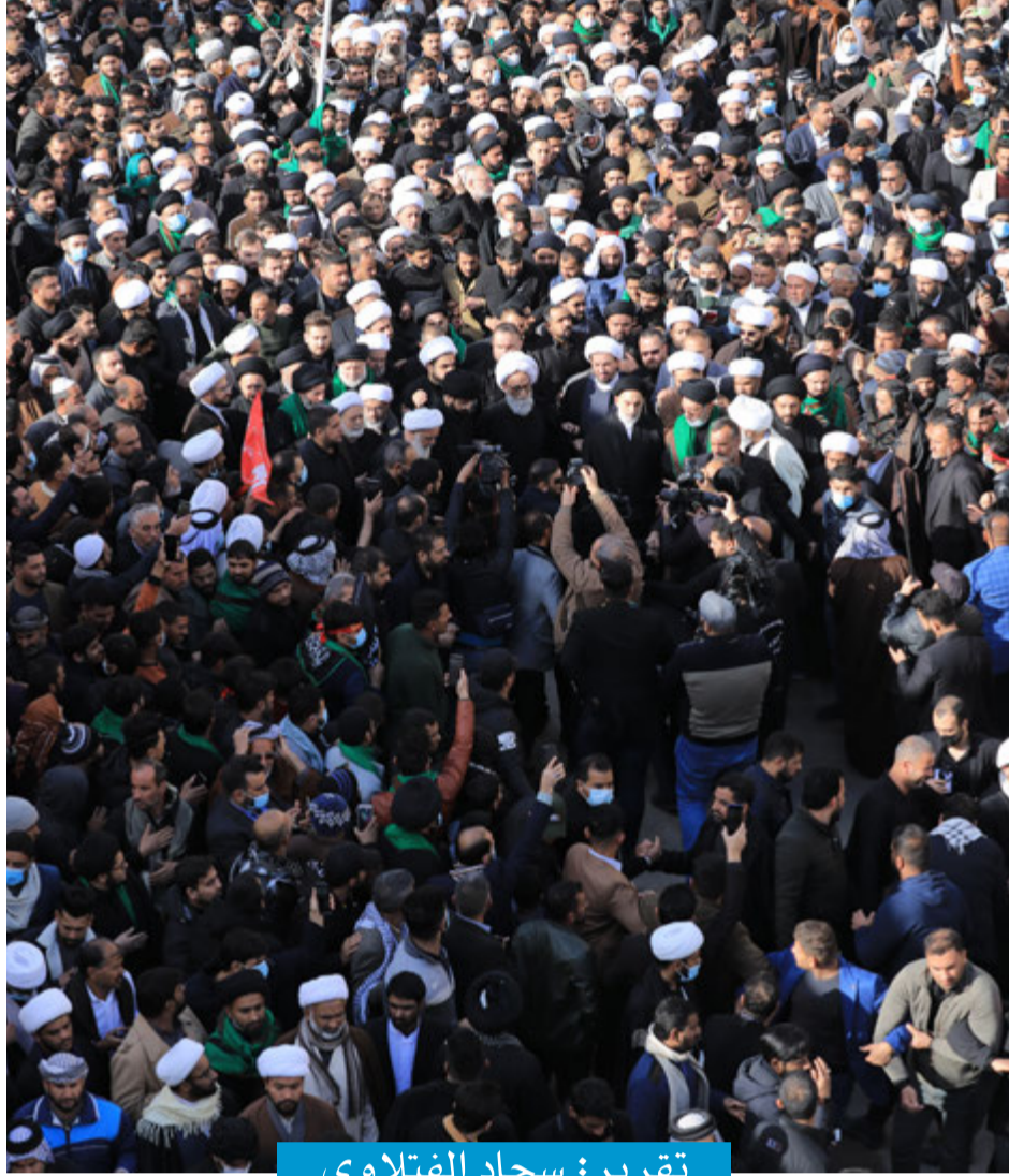
تقرير: سجاد الفتلاوي