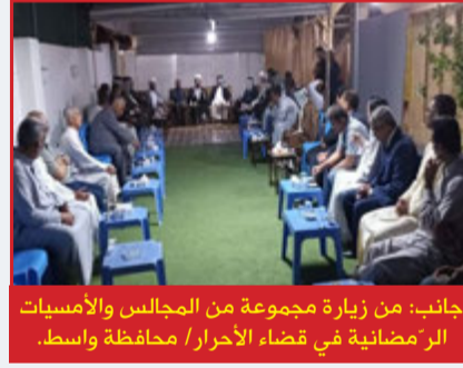
جانب: من تفقد عوائل الشهداء / قضاء الأحرار / محافظة واسط.

النجفي: يجب حث الشباب على طلب العلم وبذل جهود مضاعفة في التفوق والتحصيل العلمي؛ ليأخذوا دورهم في بناء الوطن وإصلاحه.