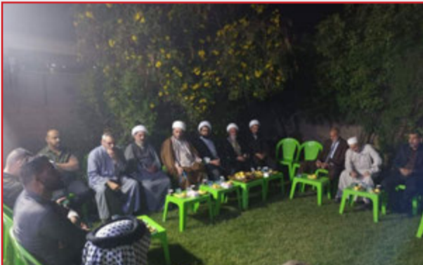
جانب: من الأمسيات الرمضانية في بيوتات وجهاء الحلة الفيحاء/ المركز.

الشباب يحتاج إلى رعاية واهتمام كبيرين في ظل حجم المؤامرات الرامية لسلب الشباب العراقي من هويته الدينية والوطنية.