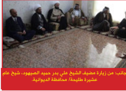
جانب: من زيارة مضيف الشيخ علي بدر حميد الصهوب، شيخ عام عشيرة طليحة / محافظة الديوانية.