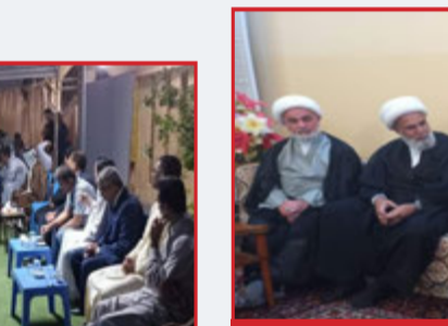
جانب: من زيارة مجموعة من المجالس والأسميات الرمضانية في قضاء الأحرار / محافظة واسط.