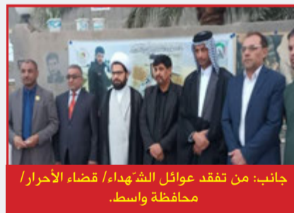
جانب: من مشاركة محفل ولادة معز المؤمنين المولى أبي محمد الحسن المجتبي (ع) في حسينية الزهراء (ع) / العزاء المركزي / النجف الأشرف.