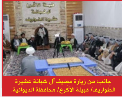
جانب: من زيارة مضيف آل شبانة عشيرة الطواريف / قبيلة الأكرع / محافظة الديوانية.