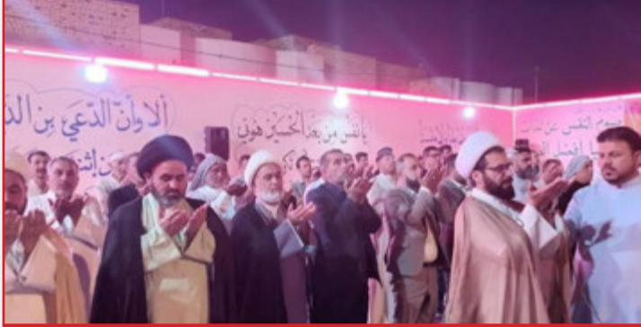
جانب: من إقامة صلاتي المغرب والعشاء، والمشاركة في محفل ولادة المولى أبي محمد الحسن المجتبي (عليه السلام) في حسينية قتيل العبرات/ محافظة ميسان/ حي النفط.

مع أفراح شعبان وحلول شهر رمضان المبارك، قام ممثل سماحة المرجع النجفي (الشيخ علي النجفي (دام تأييده) بزيارات لعدد من محافظات العراق، وكانت له وقفات مع شيوخ ورجالات القبائل والعشائر العراقية الأصيلة، شاركهم محافلهم، وشاطرهم الحوار.. هذا ولم يفت سماحته زيارة وتفقد بيوتات وعوائل الشهداء، فضلاً عن مشاركته في عدد من المحافل الاجتماعية والدينية. نضع بين أيدي قارئنا الكريم ما جاء في هذا المحطات.