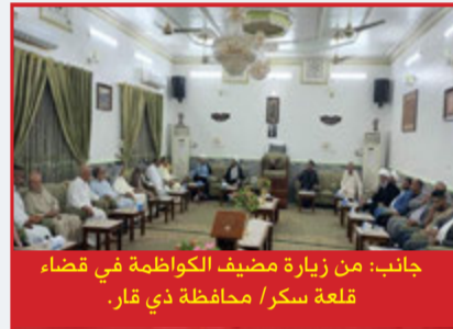
جانب: من زيارة مضيف الكواظمة في قضاء قلعة سكر / محافظة ذي قار.