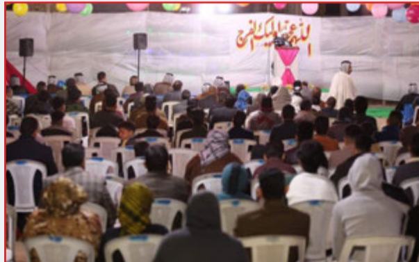
جانب: من مشاركة المؤمنين أفراحهم بمولد المولى صاحب العصر والزمان (عج) في محافظة بابل/ منطقة طفيل.