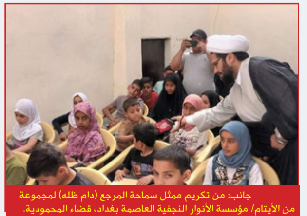
جانب: من تكريم ممثل سماحة المرجع (دام ظلّه) لمجموعة من الأيتام/ مؤسسة الأنوار النجفية العاصمة بغداد، قضاء المحمودية.

ندعو العشائر للتعاون وتحمل المسؤولية تجاه بعض العادات والتقاليد الخاطئة والسيئة والتي لا تهت للدين بصلة.