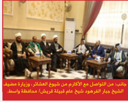
جانب: من تفقد جامع الأحرار الكبير ولقاء المؤمنين هناك / محافظة واسط.