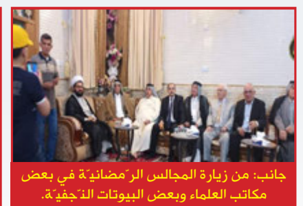
جانب: من زيارة المجالس الرمضانية في بعض مكاتب العلماء وبعض البيوتات النجفية.