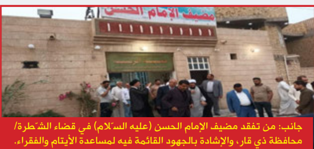
جانب: من تفقد مضيف الإمام الحسن (عليه السلام) في قضاء الشطرة/ محافظة ذي قار، والإشادة بالجهود القائمة فيه لمساعدة الأيتام والفقراء.

على الجهات المعنية في الدولة العراقية أن تولي شريحة الفقراء والأيتام رعاية خاصة، وتحرص على تأمين حياة كريمة لهم.