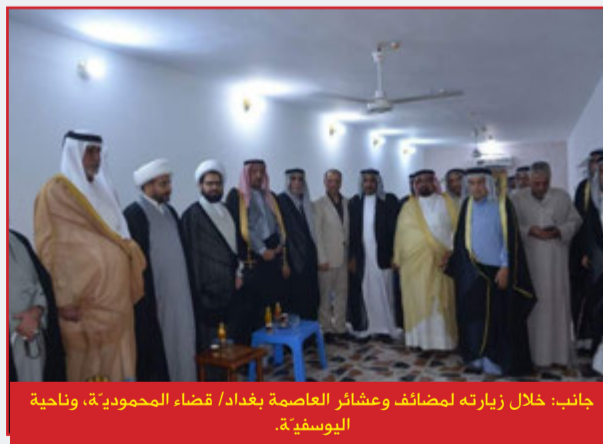
جانب: خلال زيارته لمضائف وعشائر العاصمة بغداد/ قضاء المحمودية، وناحية اليوسفية.