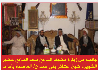
جانب: من مشاركة ممثل سماحة المرجع (دام ظلّه) في إحتفالية توزيع العباءة الإسلامية على (٦٥٠) طالبة في محافظة واسط.