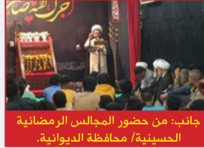
جانب: من حضور المجالس الرمضانية الحسينية / محافظة الديوانية.