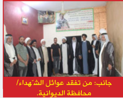
جانب: من تفقد عوائل الشهداء / محافظة الديوانية.