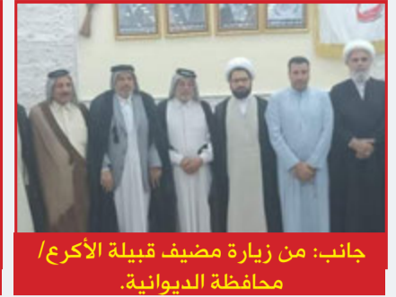
جانب: من زيارة مضيف قبيلة الأكرع / محافظة الديوانية.