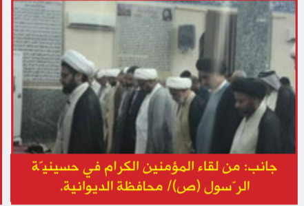
جانب: من لقاء المؤمنين الكرام في حسينية الرسول (ص) / محافظة الديوانية.