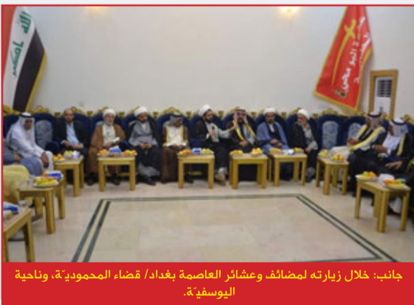
جانب: خلال زيارته لمضائف وعشائر العاصمة بغداد/ قضاء المحمودية، وناحية اليوسفية.

سماحة المرجع (دام ظلّه) يؤكد دائماً على أهمية التواصل مع عوائل الأيتام ورعايتهم مادياً ومعنوياً.