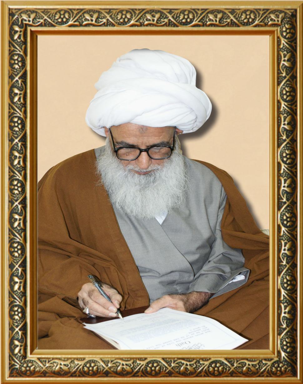
خاضع لأمر الله تعالى وتكبره كشف عن واقعه، والله العالم.

س: ما سند ومتن الروايتين: روى شيخ الطائفة محمد بن الحسن عن احمد بن علوية عن المفيد عن محمد بن خالد عن محمد بن جعفر بن قولويه عن محمد بن يعقوب الكليني عن ابراهيم بن هاشم عن أبيه عن علاء بن رزين عن عاصم بن عبد الحميد عن يونس بن عبد الرحمن عن أبي عبد الله (عليه السلام) قال: (العلم ليس بكثرة التعلم بل هو نور يقذفه الرحمن في قلب من يشاء)، فمن الواضح أن العلم يمكن تحصيله بالتعلم والدرس وليس أمراً يوهب دفعة لكننا نرى هذا العلم موجود لدى العالم غير العامل، كيف يكون نوراً موهوباً من الله تعالى؟