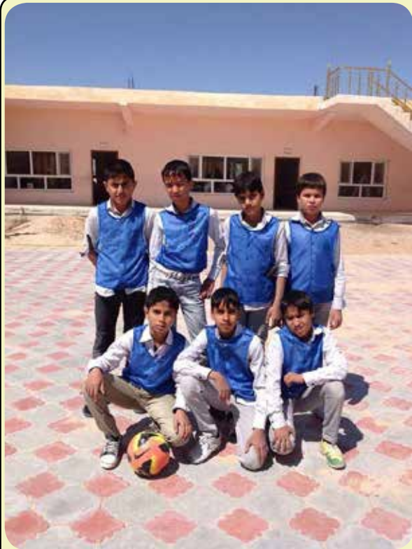
مدارس دار الزهراء الخيرية للأيتام :